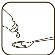
● ● ● Отмерьте нужную дозу