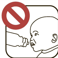
● ● ● Не давать непосредственно в рот малышу