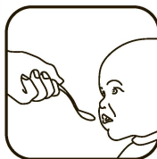
● ● ● Дайте из ложечки