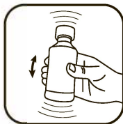
● ● ● Тщательно взболтайте

Продолжительность приема – 30 дней. При необходимости прием можно повторить.